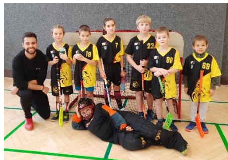
Troubelice - Zábřeh "B" 0:6

Výsledky: Troubelice - Jestřebí 4:4 Troubelice - Víkyně 6:6 Troubelice - Postřelmov 1:7 Troubelice - Zábřeh "A" 5:3